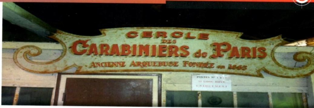
Nostalgie, certes, mais nostalgie prestigieuse !