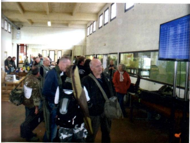
La Grande Galerie avec ces écrans d'information : tradition et modernité, c'est ça le TNV.

avec un encadrement technique au sein de l'École de tir jeune et adulte pour lesquels le TNV acquiert du matériel performant. Le TNV dans le cadre de sa politique sportive participe aux frais de tous ses compétiteurs. Par ailleurs, chaque année, plus de 60 encadrants bénévoles des clubs de tir de la